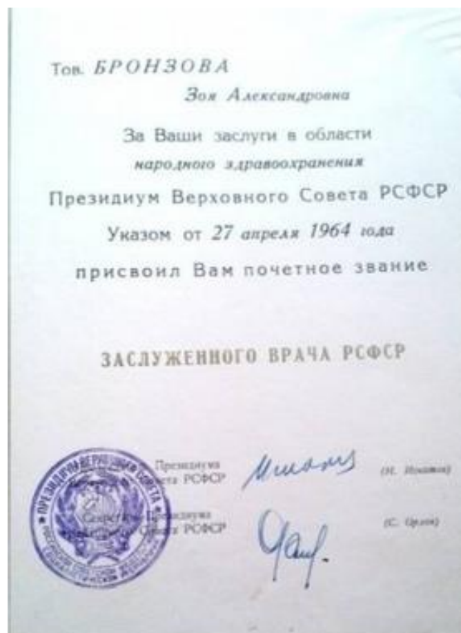
Фото 12. Документ о присвоении почётного звания Заслуженного врача РСФСР