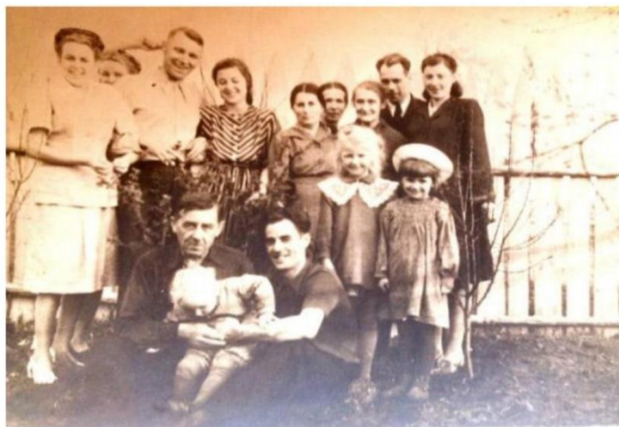
Фото 2. Молодежь села Заборье.